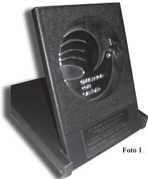
Foto 1. Premio MEN

Este premio que ubica a la institución entre las mejores en educación a nivel nacional, es el resultado de la calidad, experiencia y compromiso de directivos y cuerpo docente, y de la dedicación y esfuerzo de nuestros estudiantes del Instituto de Bachillerato Técnico Industrial. (Ver foto 1)