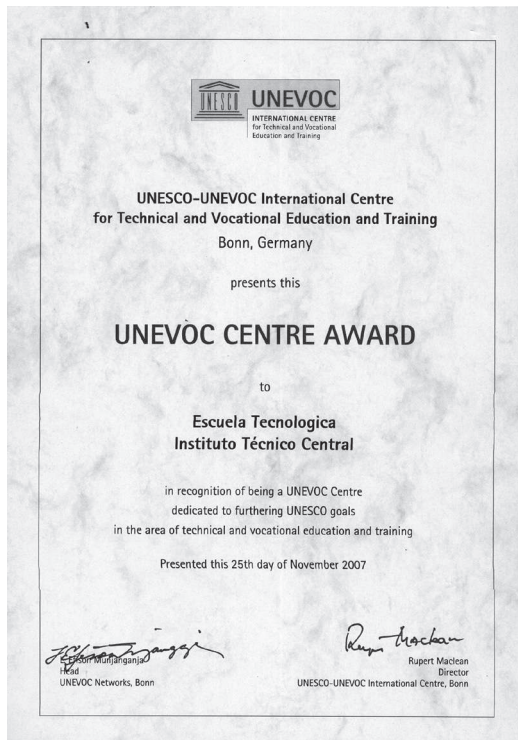
Foto 2. Diploma UNESCO- UNEVOC.