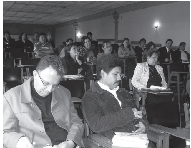
Foto 4. Encuentro de directivos y profesores de los CED y la ETITC Dic de 2008 .

Este proceso beneficia a la comunidad estudiantil, al permitirles acceder a programas de Educación superior por ciclos propedéuticos para lo cual se semestralizarán los grados décimo y undécimo de los Centros Educativos Distritales (CED). La primera fase, consiste en la caracterización de los colegios: Industrial Piloto, CEDID San Pablo, San Francisco de Asís y Eduardo Santos. (Ver foto 4)