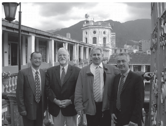
Foto 7. Visita de los representantes del Box Hill a la ET-ITC.