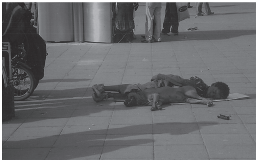
Foto 16. Título: “El mejor amigo del hombre”. Autor: María paula Briceño. Segundo Puesto, estudiantes de bachillerato