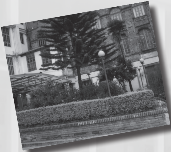
Foto 2. “Naturaleza”. Autor: Jhonny Enrique Pineda Muñoz. Estudiante de bachillerato