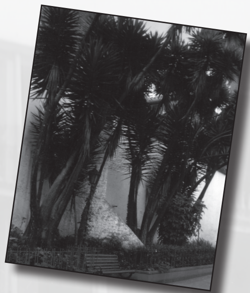
Foto 3. “Bajo las palmas”. Autor: Miguel Ángel Rodríguez Gómez. Estudiante de bachillerato