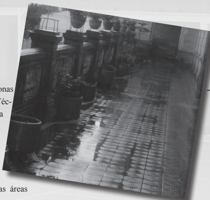
Foto 15. Seudónimo: Chester. Título: “Por fin tenemos zonas verdes”. Lugar: Corredor Escuela Tecnológica Instituto Técnico Central. Descripción: Nuestro empeño es el que cada día nuestra Escuela Tecnológica sea mejor. Somos todos los que formamos parte de esta gran familia de aportar un granito de arena para conservar todos los recursos que tenemos y buscar cualquier oportunidad para crear zonas que no permitan vivir mejor y hacer mas agradable nuestra estadía en la Escuela Tecnológica, incluyendo las pocas áreas verdes disponibles con las que contamos.