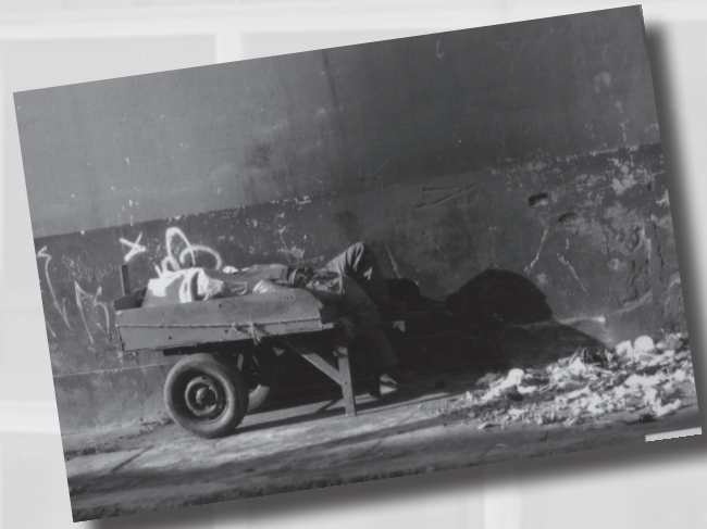
Foto 10. “Soñando entre ruedas”. Autor: Paola Andrea Garnica. Categoría Estudiantes de Bachillerato