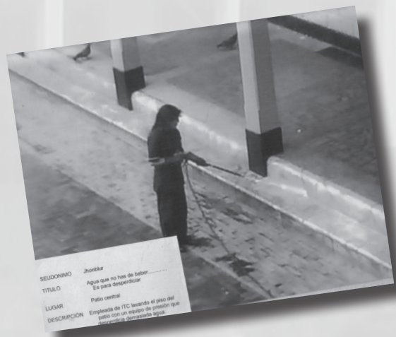
Foto 5. “Agua que no has de beber... es para desperdiciar”. Autor: Jhon Henry Pinzón. Tercer puesto Estudiante de Educación Superior