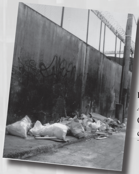
Foto 9. “Patio trasero”. Autor: Juan Pablo Neira Ceballos. Categoría Estudiantes de Bachillerato