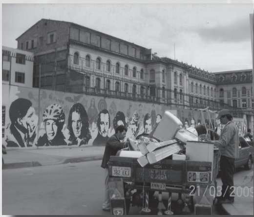
Foto 11. “Reciclando vamos ganando”. Autor: José Prieto. Segundo puesto. Categoría docente y administrativa.