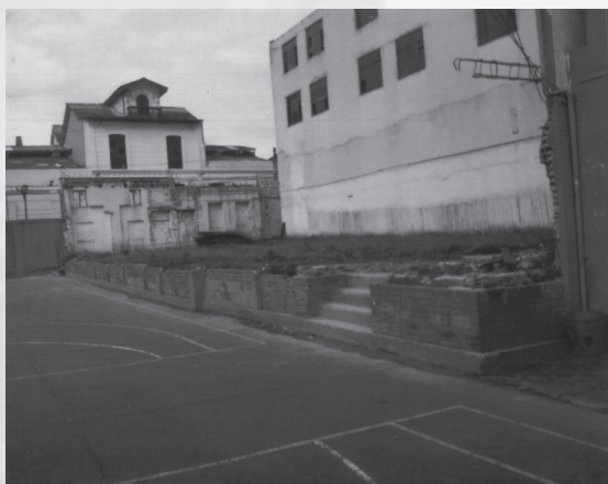
Foto 7. “Lo olvidado del instituto”. Autor: Fransua Forero. Estudiante de Educación Superior