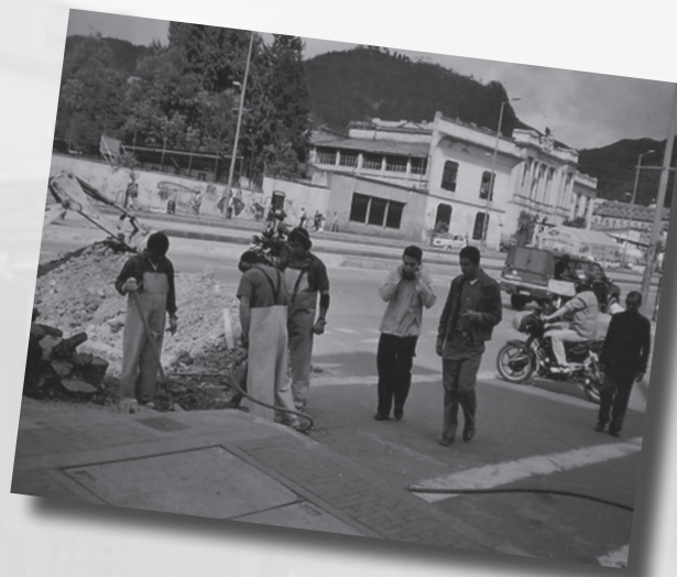
Foto 13. “Una ciudad sin oídos”. Autor: María Paula Briceño Ramírez. Categoría Estudiantes de Bachillerato