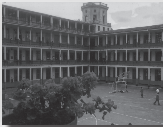
Foto 4. “Flores de concreto”. Autor: Juan Pablo Neira Ceballos. Primer Puesto categoría Estudiantes de Bachillerato.