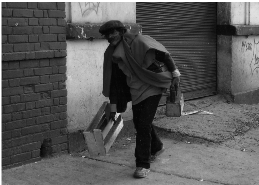
Título de la foto “Yo colaboro”. Autor: José Luis Garnica. Estudiante de Educación Superior de la ET ITC