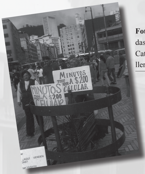
Foto 12. “¿Aquí venden llamadas?” Autor: Pedro L. Mendoza. Categoría Estudiantes de Bachillerato