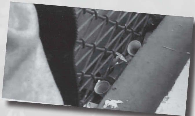
Foto 6. “Como no lo vemos”. Autor: Jhon Henry Pinzón. Estudiante de Educación Superior