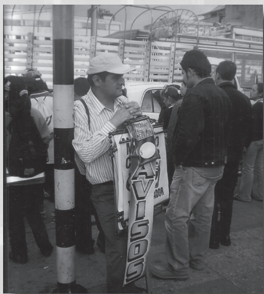
Foto 14. “Se venden avisos”. Autor: Pedro L. Mendoza. Categoría Estudiantes de Bachillerato.

Foto 15. Seudónimo: Chester. Título: “Por fin tenemos zonas verdes”. Lugar: Corredor Escuela Tecnológica Instituto Técnico Central. Descripción: Nuestro empeño es el que cada día nuestra Escuela Tecnológica sea mejor. Somos todos los que formamos parte de esta gran familia de aportar un granito de arena para conservar todos los recursos que tenemos y buscar cualquier oportunidad para crear zonas que no permitan vivir mejor y hacer mas agradable nuestra estadía en la Escuela Tecnológica, incluyendo las pocas áreas verdes disponibles con las que contamos.