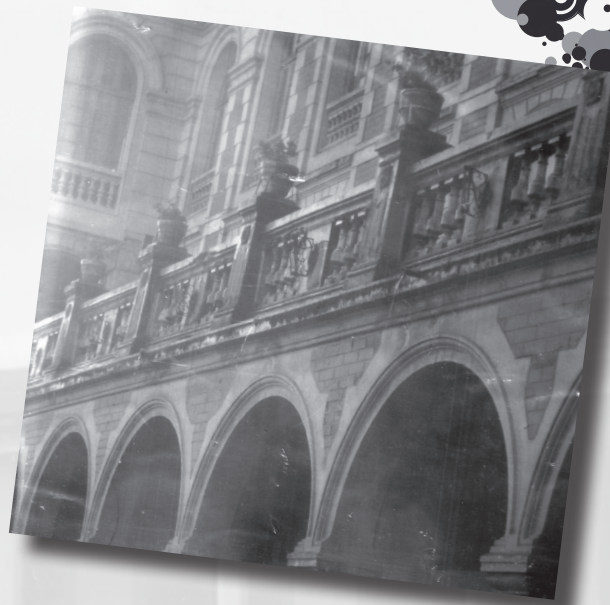
Foto 8. “Escuela Tecnológica libre de humo”. Autor: Geithner León Vizcaya. Categoría docente y administrativa