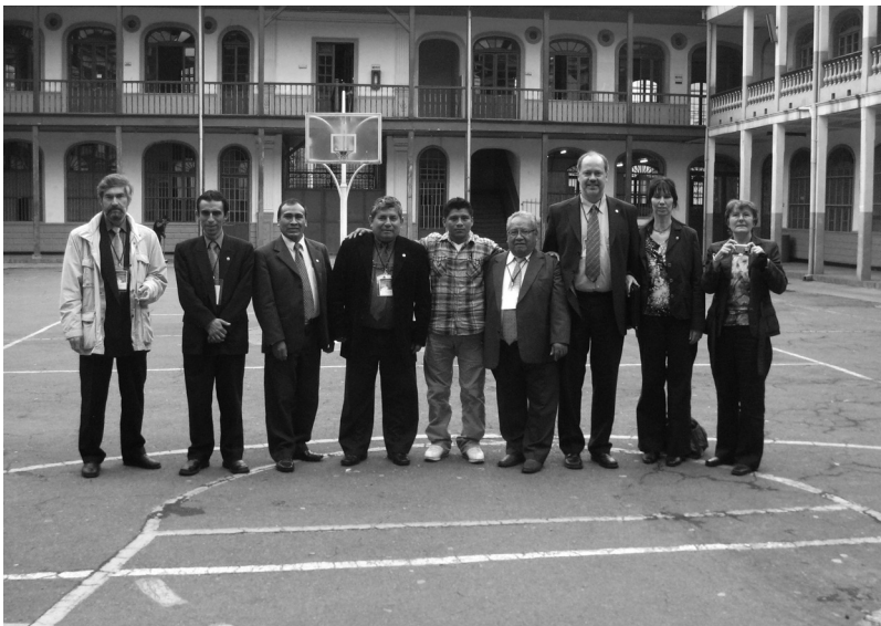
Foto 7. Visita de participantes internacionales del Foro a la ET ITC

Finalmente, se sugirieron algunas acciones a corto plazo encaminadas a fortalecer la cooperación entre los miembros y las instituciones participantes, tales como: Estrechar vínculos de coope-