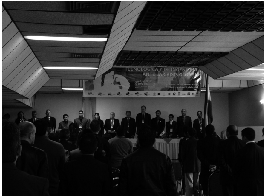
Foto 3. Inauguración del III Congreso con delegados internacionales y representantes del MEN y de la Secretaria de Educación del Distrito

Las expectativas de las grandes, medianas y pequeñas empresas en lo que se refiere a la formación profesional se enfocan en las necesidades de cursos de educación continuada, oferta de consultorías y paquetes de entrenamiento específicos, pasantías para estudiantes y profesores, fomento de redes de conocimiento e intercambio, currículos y metodologías dinamizadoras y que fomenten la creatividad y la investigación, profesores comprometidos, motivados y actualizados y una gestión que involucre sus requerimientos y posibilidades.