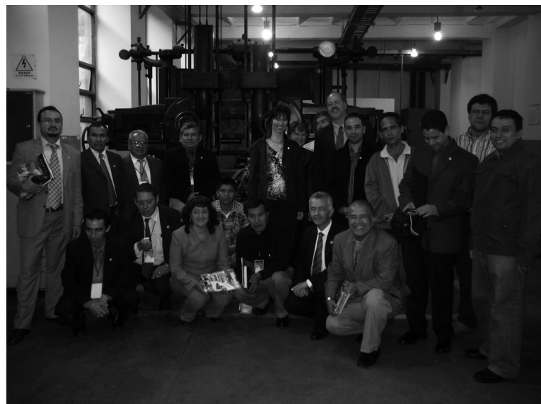
Foto 5. Visita de las delegaciones participantes del Congreso a las instalaciones del ET ITC