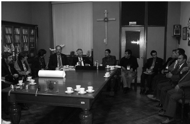
Foto 8. Protocolización del plan de acción conjunto a realizar en el mediano plazo entre los países participantes

ración entre las instituciones asistentes al congreso para dar una respuesta con pertinencia y calidad a la crisis global y a las realidades locales, regionales y nacionales.