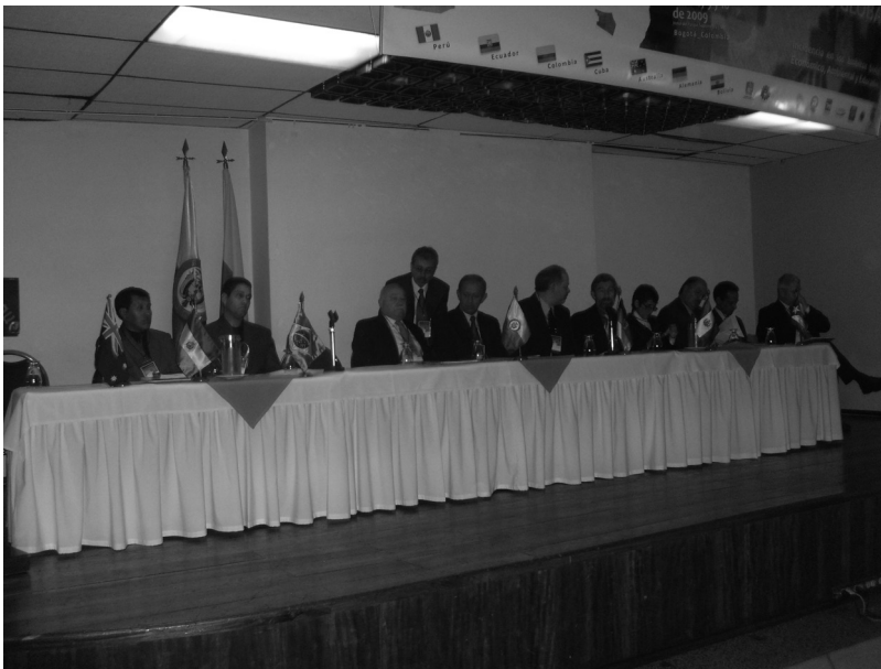
Foto 1. Mesa directiva compuesta por representantes de los siete países participantes

participativos, solidarios, respetuosos y armónicos con el ambiente y los demás seres vivos.