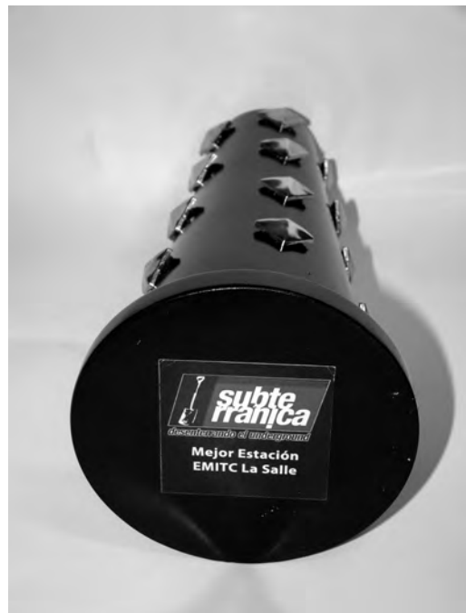
Foto 2. Trofeo recibido por EMITC como “Mejor Página Web o Estación OnLine” en la V Entrega de los Premios Subterránea Colombia 2011